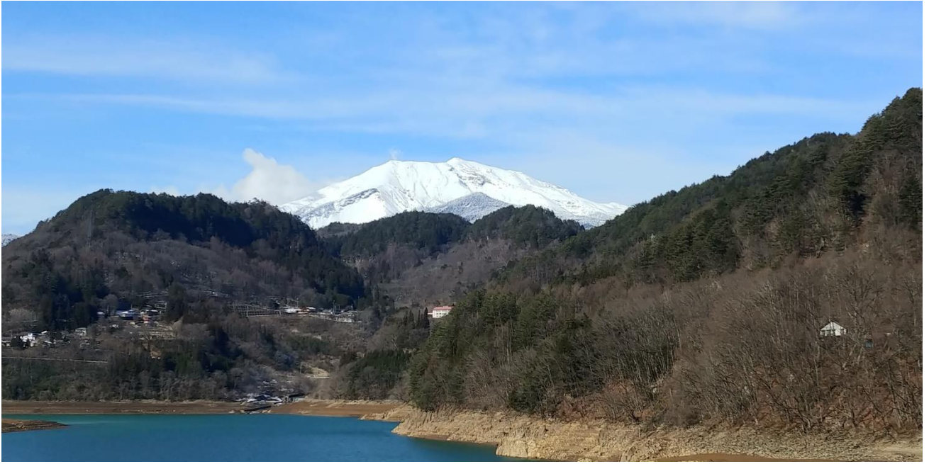
木 曾 御 嶽 山